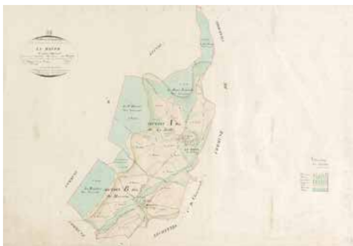
© Arch. dép. Vosges, 3 P 4968_4 (détail)